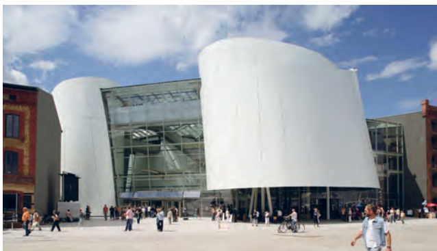
Das Ozeaneum unseres Projektpartners Deutsches Meeresmuseum in Stralsund

www.orca-climate.org : Über uns, Referenzen